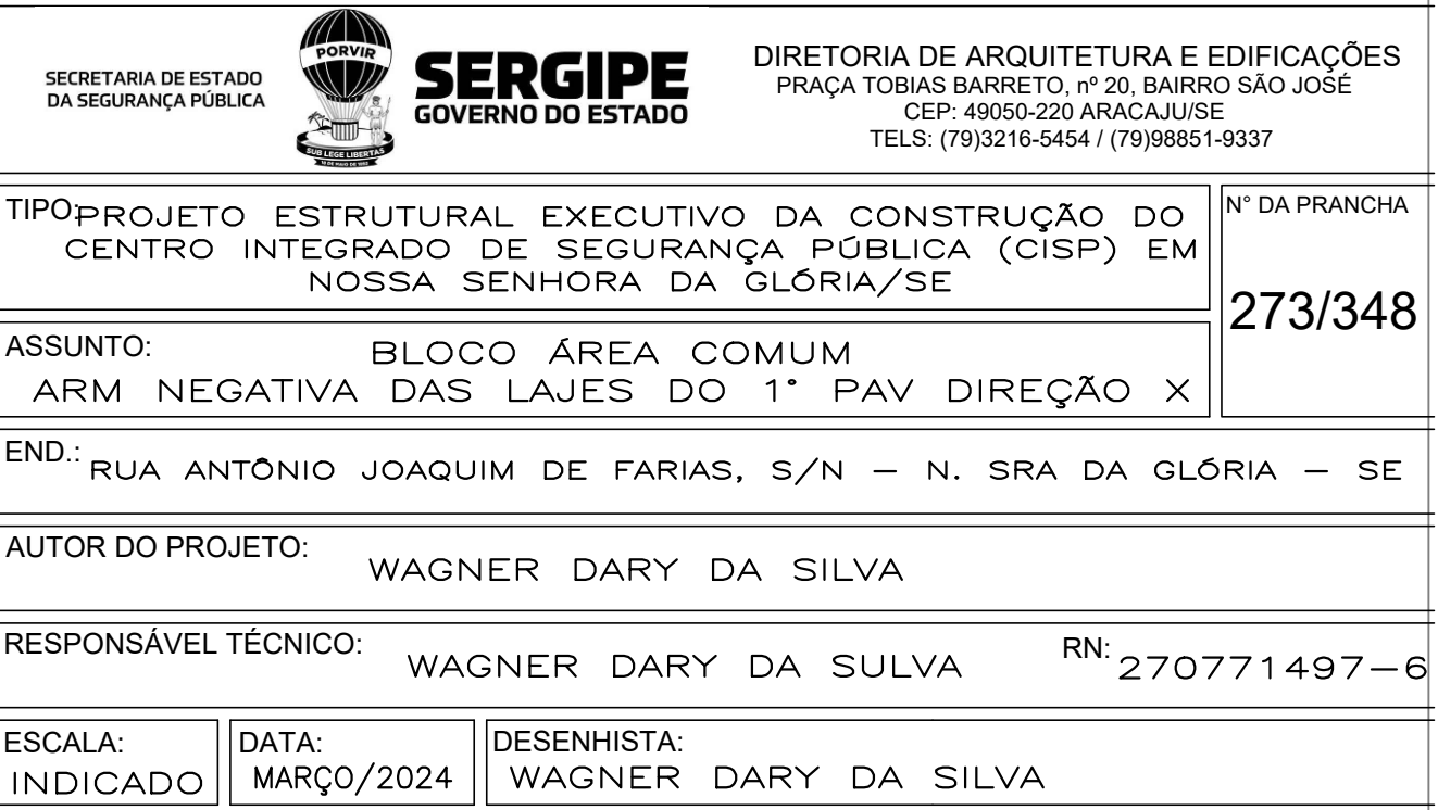
BLOCO ÁREA COMUM PRANCHAS: 212 a 295